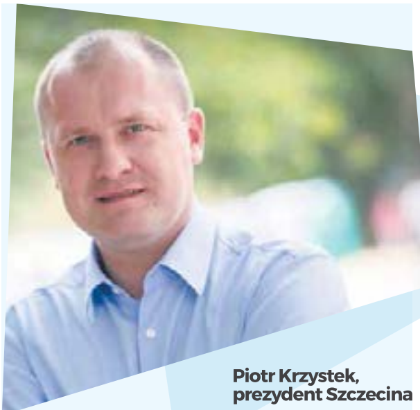
Piotr Krzystek, prezydent Szczecina

nazwie, stąd liczba „II” przy nazwie jednostki. Może zabrać 90 członków załogi, w tym 54 stałych i 36 stażystów. Żaglowiec ma charakterystyczny kadłub w kształcie litery V i podobnie jak np. klipry został zbudowany z myślą o szybkości. Osiąga do 17 węzłów.